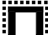
Tipo U - U Shape